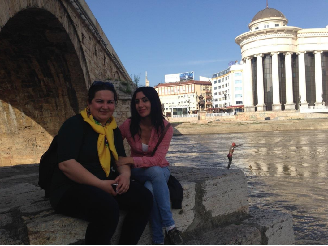
Taşköprü altında otururken

geleneğinin örneklerini taşıyan Mustafa Paşa Camiini görebilirsiniz ki camii tüm şehre hakim ve her yerden görünebiliyor. Ama cami hakkında ne girişte ne de bahçe kısmında pek bir bilgi yok ☹