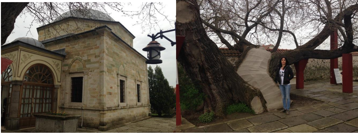
Türbe ve bahçesindeki anıt ağaç

Müslümanlığın simgesi olarak kabul görüyor. Türbe, 1845 yılında Serasker Hurşid Paşa emriyle temelden üste kadar onarım görmüş. 1989 yılında I. Kosova savaşı'nın 600. yıldönümü kutlamaları nedeniyle, Yugoslavya Devleti tarafından türbenin ve selamlığın onarımı sadece türbenin badanalanması şeklinde uygulanmış. Yapısal bozulmalar ya da deformasyonlar nedeniyle yıpranan Sultan Murat Türbesi 2005 yılında Türk İşbirliği ve Koordinasyon Ajansı Başkanlığı (TİKA)'nın katkısıyla ile Türkiye Diyanet Vakfı tarafından restore edilmiş.