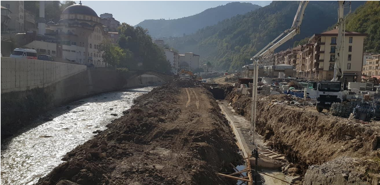
Resim 28. Dereli ilçesinden çalışmalar