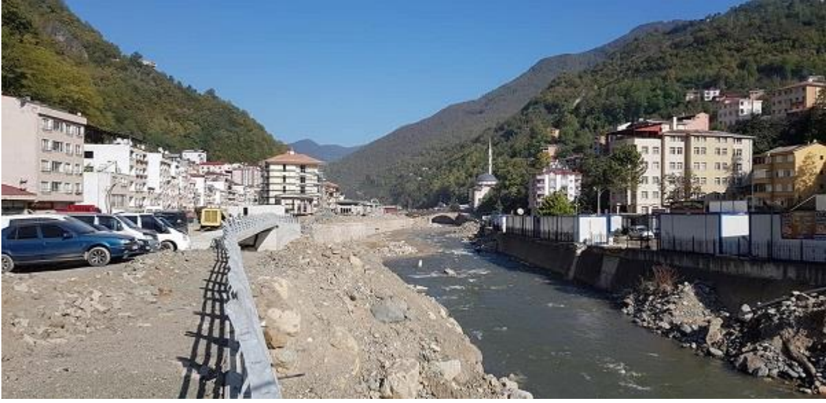
Resim 29. Dereli ilçesinden çalışmalar

Dereli ilçesinde sel hadisesinin yaşanmasından bu güne yaraların çok hızlı bir şekilde sarıldığı görülmüş, selin nedenleri ve etkileri müzakere edilmiştir.