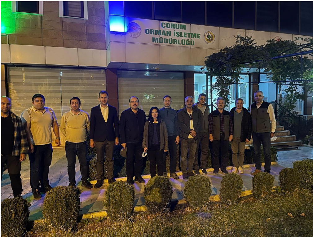
Resim 36. Çorum Orman İşletme Müdürlüğü

Dönüş yolu esnasında Çorum Orman İşletme Müdürlüğü ziyaret edilerek çalışmalar hakkında bilgi verilmiştir.