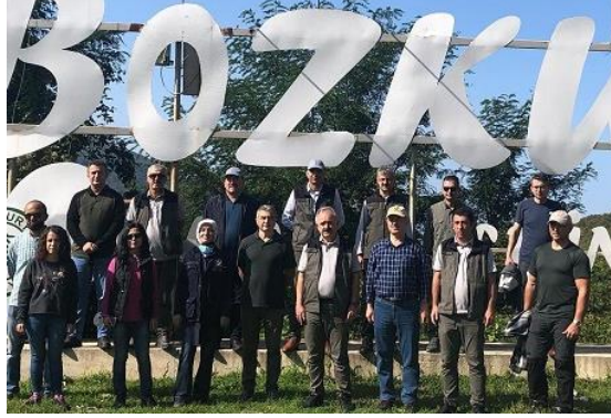
Resim 9. Bozkurt İlçesi girişi

Üst havzalardaki incelemeleri takiben Bozkurt ilçesine geçilerek Orman İşletme Müdürlüğü ve Bozkurt ilçesi sel sularının dere yatağından taşarak yerleşim alanlarına giriş yaptığı üst kısımda incelemelerde bulunulmuştur.