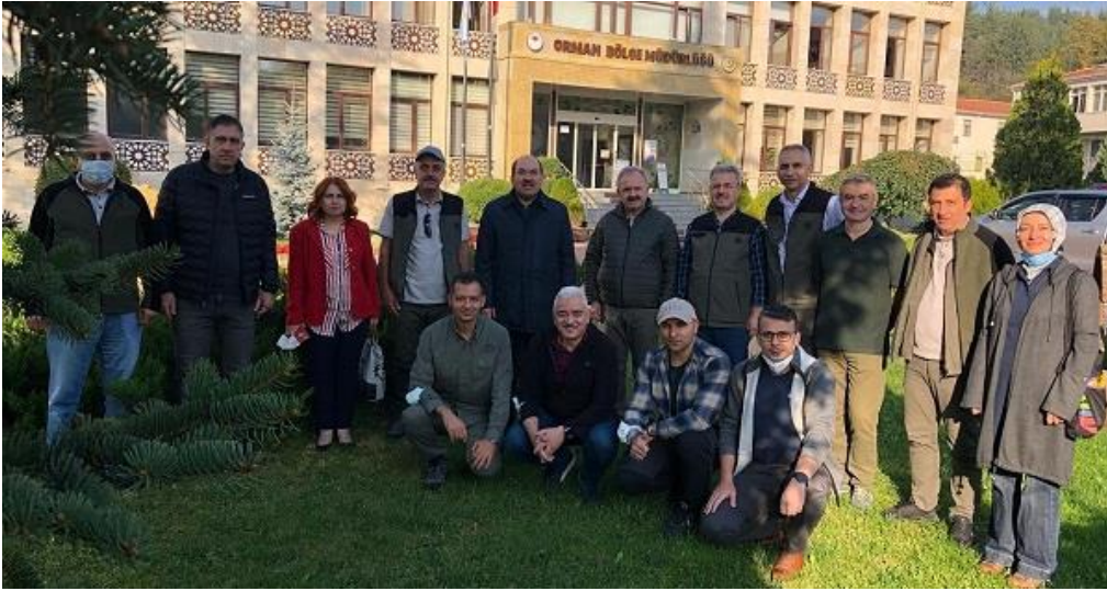
Resim 5. Kastamonu Orman Bölge Müdürlüğü bahçesi

Devamında Ezine Çayı'nın taşması sonucu sel felaketi yaşanan Bozkurt ilçesi incelenmiş, ilgili meslektaşlarımızdan bilgi alınmıştır.