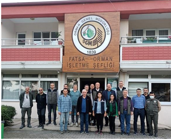
Resim 19. Fatsa Orman İşletme Şefliği ziyareti