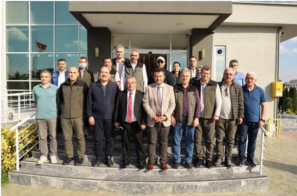
Resim 18. Terme Kaymakamı ziyareti