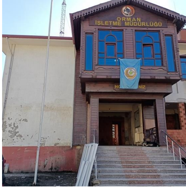
Resim 10. Bozkurt Orman İşletme Müdürlüğü

Üst havzalardaki incelemeleri takiben Bozkurt ilçesine geçilerek Orman İşletme Müdürlüğü ve Bozkurt ilçesi sel sularının dere yatağından taşarak yerleşim alanlarına giriş yaptığı üst kısımda incelemelerde bulunulmuştur.