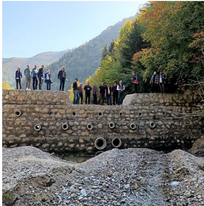
Resim 30. Islah sekisi üzerinde inceleme

Dereli'deki incelemeyi takiben havzanın üst bölümünde yer alan Akkaya mntıkasında, Bölge Müdürlüğünün sel kontrol çalışmaları çerçevesinde yaptığı ıslah sekileri hakkında değerlendirmelerde bulunuldu.