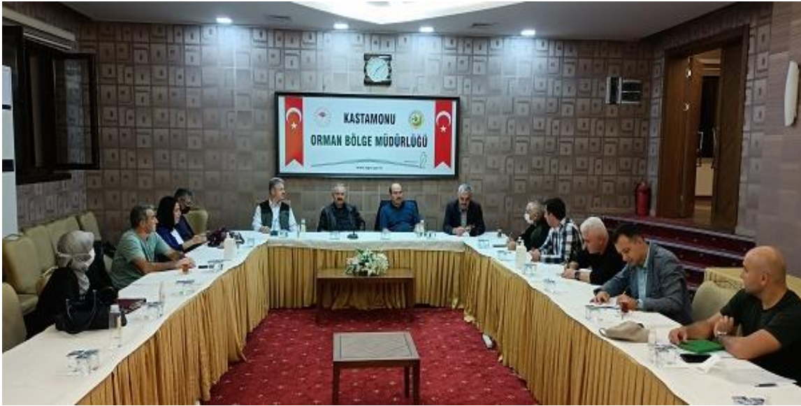
Resim 4. Kastamonu Orman Bölge Müdürlüğünde toplantı salonu

Arazi incelemesine 11.10.2021 Pazartesi günü saat 14:00 daa OGM F kapısından 2 adet minübüs ile başlanılmıştır. Saat 18.30 da Kastamonu ya ulaşılmıştır. 17.00 da Kastamonu Orman Bölge Müdürlüğü toplantı salonunda değerlendirme toplantısı yapılmıştır.