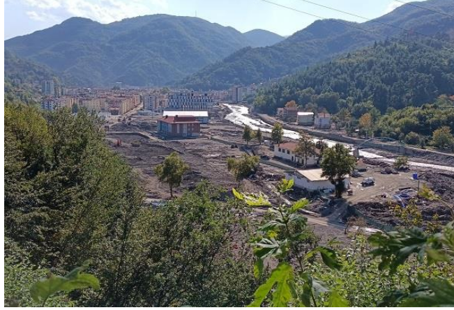
Resim 13. Bozkurt Orman Deposunda ilçeye doğru bakış

Sel ve taşkınlar için en önemli hususlardan birinin erken uyarı sistemi olduğunu, bir gün önceki yağışta Ezine çayınının 30-40 cm. taşmış olduğunu, belediyenin anons yaparak sel geldiğini söylemesine rağmen halkın bir önceki gün gibi olacak düşüncesiyle yeterince önemsemediğini söyledi.