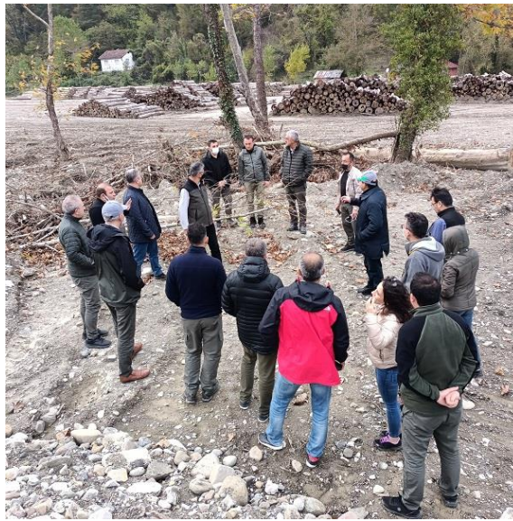
Resim 14. Ayancık Orman İşletme Müdürlüğü Deposu

Programın devamında Ayancık Orman İşletme Müdürlüğüne ait depo alanına gidilerek incelemelerde bulunuldu. Burada depo alanının oldukça geniş bir dere yatağına kurulmuş olması, normalde herhangi bir taşkın olmaması gerektiği ancak uzun süreli ve çok yoğun yağışın olması nedeniyle sel ve taşkın yaşandığı dile getirildi.