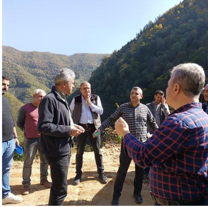
Resim 31. DSİ ekibi ile yapılan değerlendirme

Devlet Su İşleri Genel Müdürlüğünden katılan ekibin yapılan çalışmalar hakkındaki görüşleri alındı.