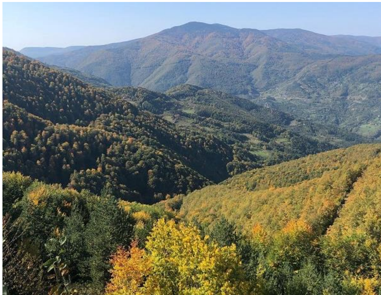
Resim 6. . Ezine çayını besleyen üst havza görüntüsü