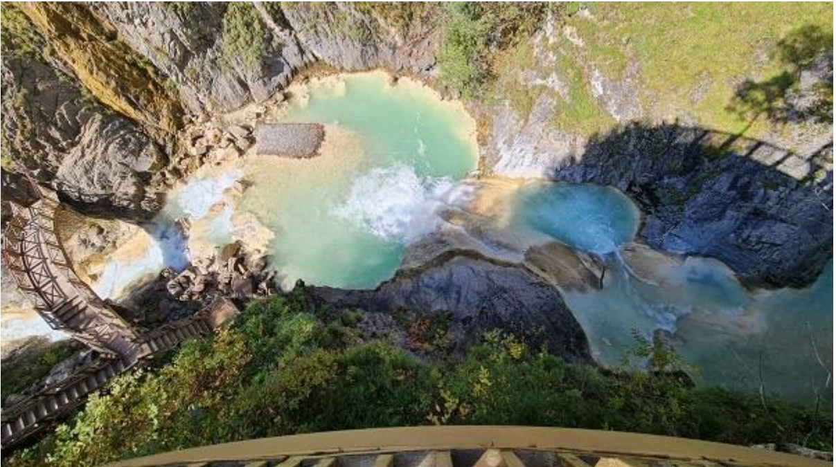
Resim 32. Mavi Göl

Bu incelemeleri takiben arazinin peyzaj değerleri açısından son derece önemli bir işlevi ifa eden Mavi Gölde DKMP Genel Müdürlüğünün yaptığı çalışmalar incelendi.